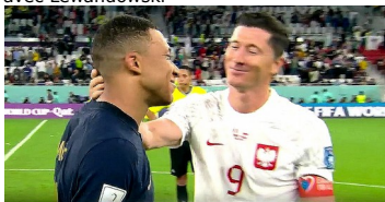
Mbappé avec Lewandowski