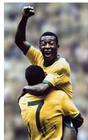
Pelé avec Jairzinho en 1970