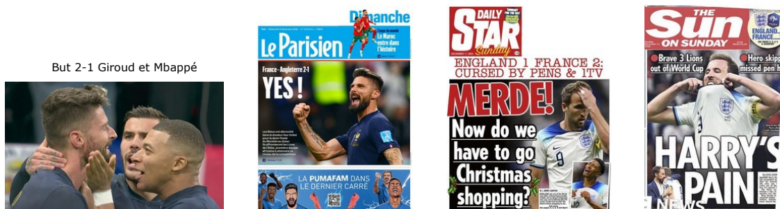
But 2-1 Giroud et Mbappé

la presse française et anglaise après France-Angleterre ..